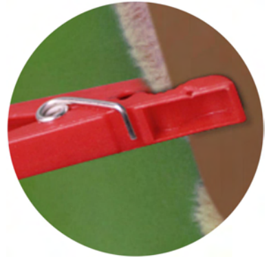
Befestigung mit Wäscheklammern